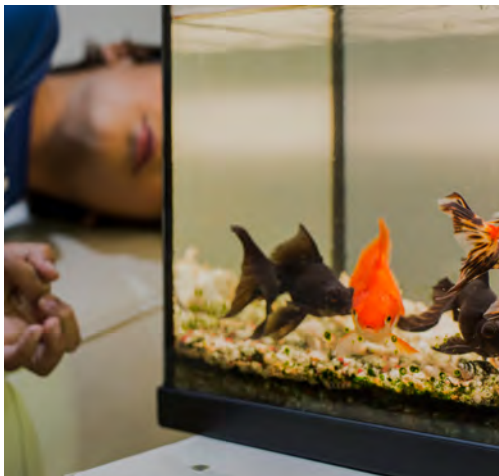
HOOP & TOEKOMST