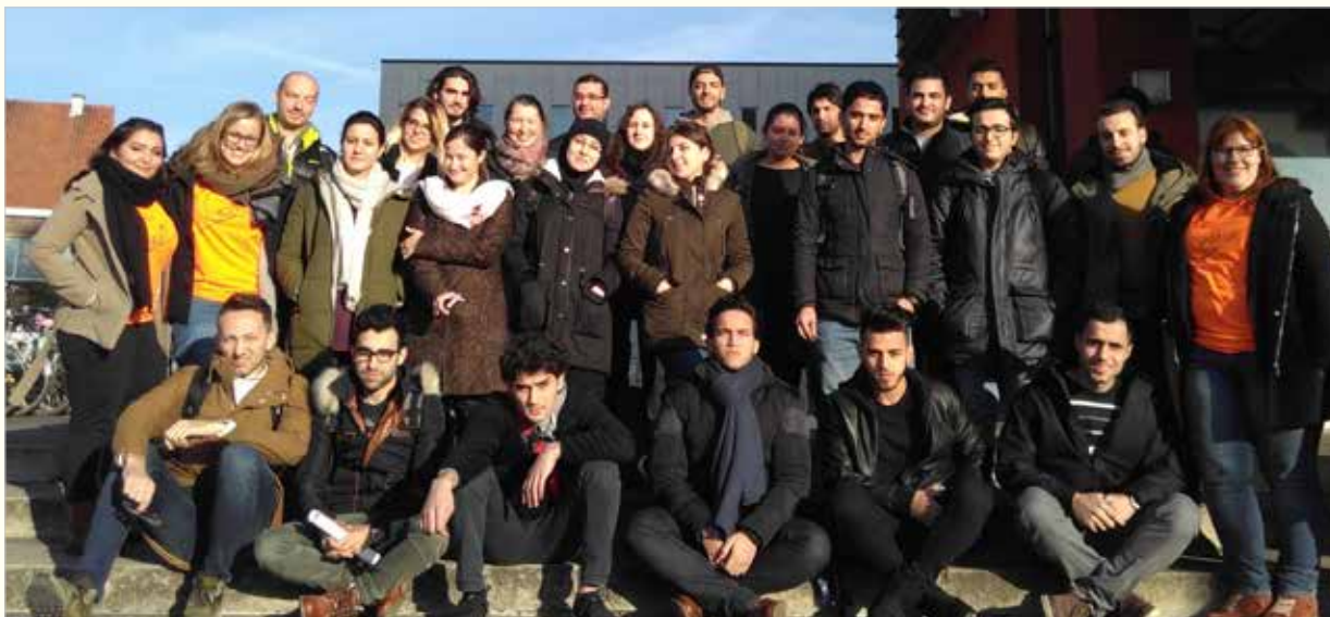
Deelnemers Voortraject Hoger Onderwijs

Oud- en nieuwkomers die in Gent wonen en willen verder studeren kunnen bij IN-Gent vzw terecht voor informatie over opleidingen en voor individuele begeleiding bij het bepalen van een studiekeuze en het aanpakken van mogelijke drempels. Hiervoor werken we samen met De Stap. In 2016 waren er 172 dossiers.