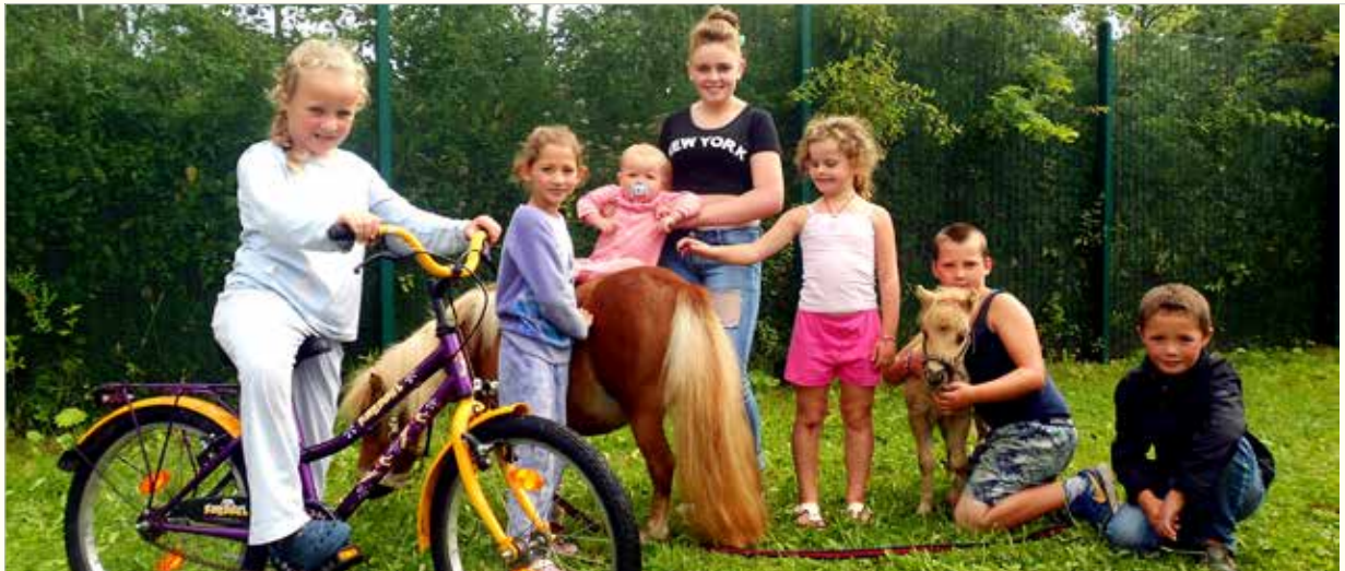
Bewoners van het doortrekkersterrein

IN-Gent vzw beheert het doortrekkersterrein voor rondreizende woonwagenbewoners aan de Drongensesteenweg. Dat biedt plaats aan maximum 25 woonwagens. In 2016 verbleven er 164 gezinnen.